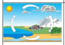
CYCLE DE L'EAU Cycle de l'eau