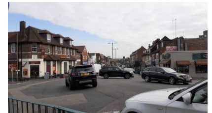
Le quartier où Paddington et Lucie habitent