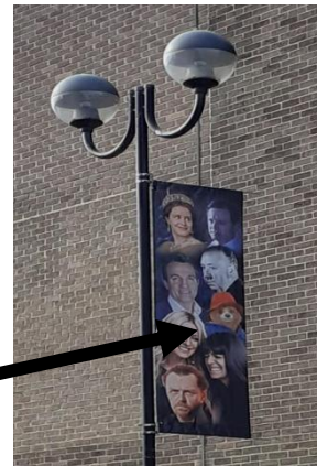
Paddington sur les affiches