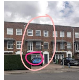
Maison où Lucie garde des enfants