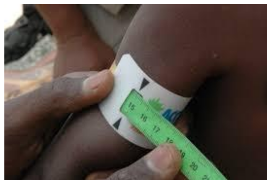
« Un bracelet » : périmètre brachial pour mesurer le tour de bras d'un enfant et détecter la sous- Nutrition.