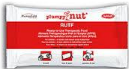
« La pâte » : aliment thérapeutique utilisé pour traiter la sous-nutrition